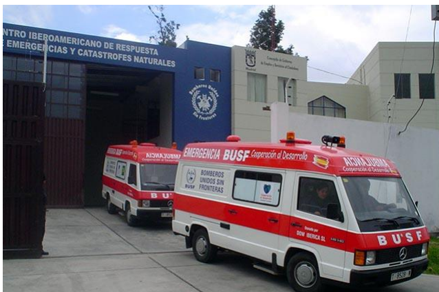
Sede BUSF Perú

La sede de BUSF Perú cuenta con dos centros de respuesta ante catástrofes naturales en Arequipa, zona de sierra, y en Iquitos, zona de selva. Los centros están dotados con diferentes materiales y equipos para las maniobras de rescate y con una planta de potabilización de emergencia. A nivel de recursos humanos, la sede de Perú cuenta con un G.I.C. y personal asalariado. El G.I.C. está compuesto por 40 voluntarios entre bomberos voluntarios y sanitarios y personal profesional permanente.